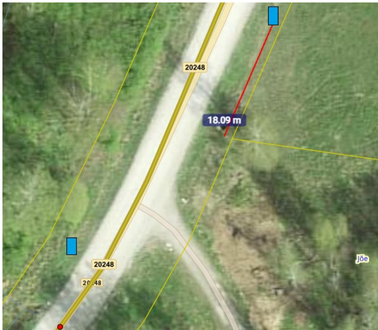
Joonis 2. „Jõe“ peatuse asukohad

Taotluse kohaselt ja lähtudes Transpordiameti juhendist „ Teede projekteerimine “ (kinnitatud 06.01.2026, edaspidi juhend ) on taotletud asukohtadesse sobilik kavandada ooteplatvormita ja -kojata peatused, millele ehitatakse ooteala riigitee peenra laiendusena ja tähistatakse liiklusemärgiga 541a (juhendis tüüp IV peatus sõidurajal).